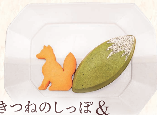
きつねのしっぽ & きつねクッキー(抹茶) 620円

素材本来の風味を活かし、甘さを控えた抹茶クリームと、濃密なガトーショコラを合わせました。ほろ苦さと芳醇な香りが重なり合う、「和」のマリアージュをご堪能ください。