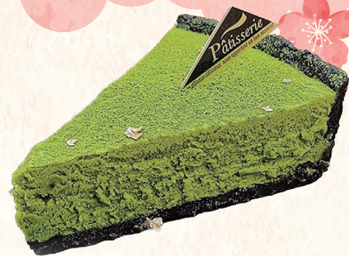
新緑の抹茶タルト 780円

竹駒の杜に吹く爽やかな風をイメージしたタルトです。ひと口含めば、香り高い抹茶の風味が、雪のようにふんわりと優しく溶けて広がります。