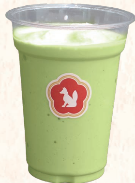
緑狐シェイク(抹茶) 550円

甘みのある福島県産豚をサクッとジューシーな豚カツに。さっぱりとした梅おろしを添えて、春らしく軽やかに楽しめる一皿です。